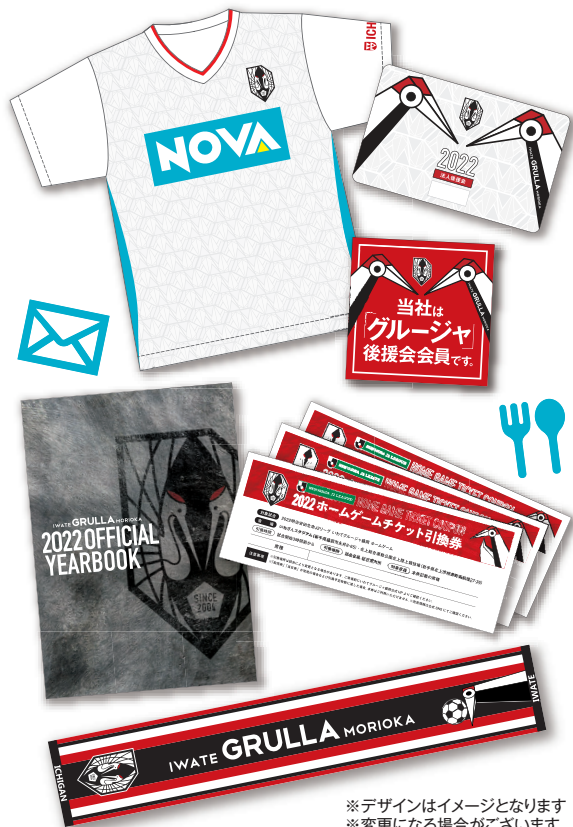
*デザインはイメージとなります *変更になる場合がございます